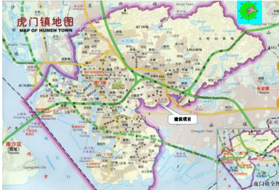
图 3-1 厂区地理位置图

东莞市嘉联包装制品有限公司位于东莞市虎门镇大宁社区浦江路61号C区三楼（地理坐标：N22°48'33.09"，E113°42'49.46"），地理位置见图 3-1，厂区平面布置及监测点位图见图 3-2。